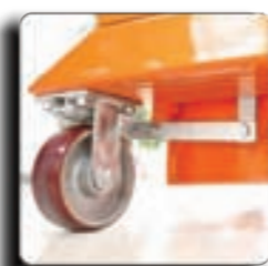
自动刹车系统-选配